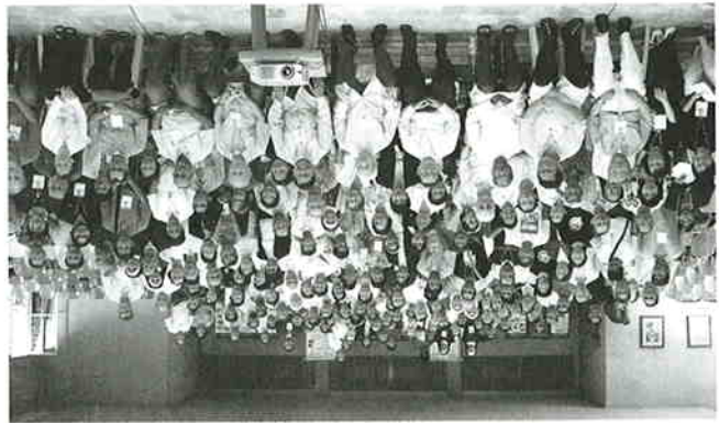
「第四屆亞洲大洋洲聖經大會」近二百名的參加者在會議場館來個大合照。

德加南神父引述亞洲主教團協會的文件時指出：「亞洲神學是一項新的事業，仍處於發展及實驗的旅途中。《啟示憲章》所展示的廣闊視野，可光照我們從亞洲大洋洲的境況中看到天主自我啟示的臨在和行動，當中包括婦女運動、土著民族運動及環保運動等。我們更可